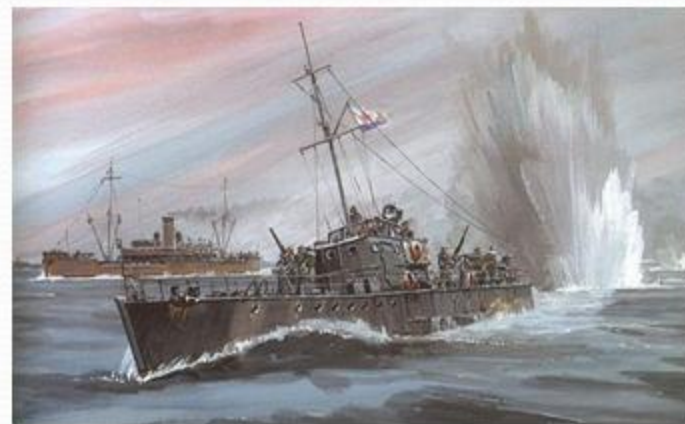
Малый охотник в море