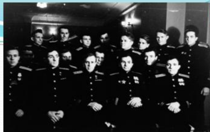
Командиры торпедных катеров 1944 год

В настоящее время традиции героев-катерников продолжают воины-ракетчики Печенгской Краснознаменной тактической группы малых ракетных кораблей.