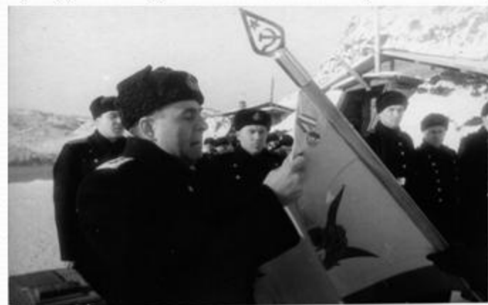
Адмирал Головко А.Г., командующий СФ прикрепляет орден Ушакова первой степени