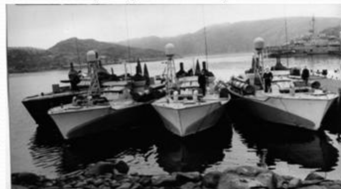
Торпедные катера А-1 в базе. г. Полярный 1944 год